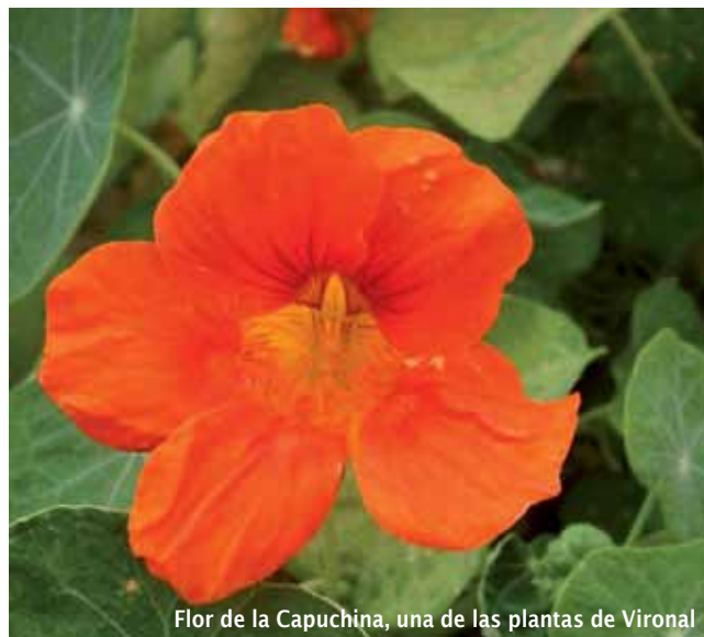
Flor de la Capuchina, una de las plantas de Vironal

De los preparados le salió Vironal , Drags Imun , Grepofit , Imunosan ,