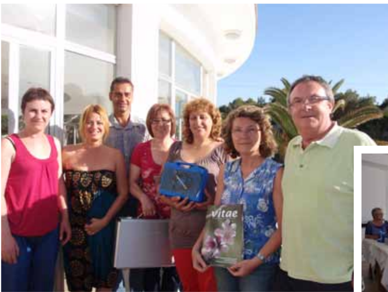
Menorca, junio 2012