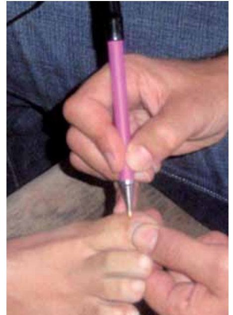
Punto de Proteasas en el Páncreas

Cualquier practicante o conocedor de la electropuntura bioenergética dispone de una serie de informaciones funcionales del organismo muy interesantes, como por ejemplo, el estado energético de los grupos enzimáticos (proteasas, amilasas, nucleasas y lipasas), localizables en el meri-