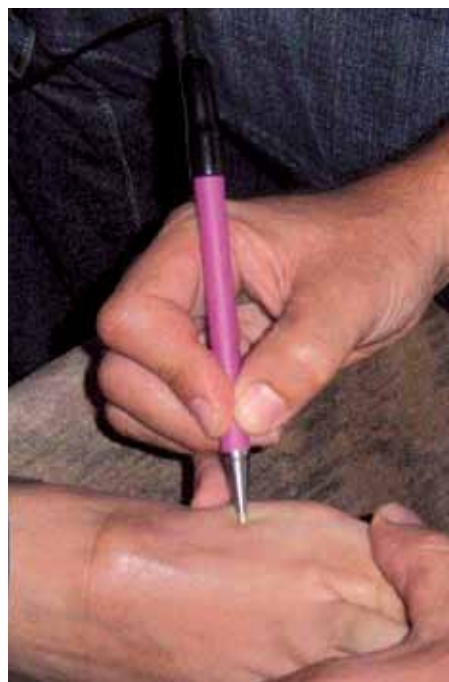
Punto de Amilasas en el Páncreas

Para poder interpretar correctamente la información energética que nos ofrece el propio cuerpo, es preciso realizar un test de resonancia aplicando una metodología altamente eficiente, si bien poco conocida entre