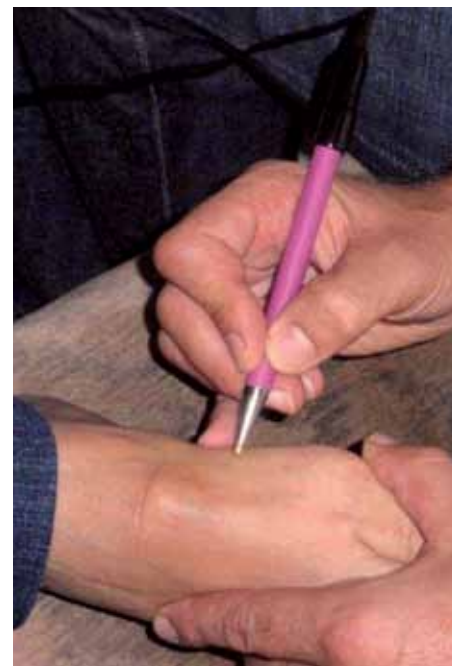
Punto de Lipasas en el Páncreas

Esto se produce gracias al fenómeno del principio de resonancia. Las características del preparado o nutriente vibracional nos permiten desarrollar una interpretación muy coherente. Los productos de la empresa Energy cumplen con estas condiciones, de manera que el profesional de electropuntura es capaz de atender a su paciente o cliente en menos de una hora y siempre facilitando el preparado o la combinación necesaria de ellos procedente del vademécum de Energy .