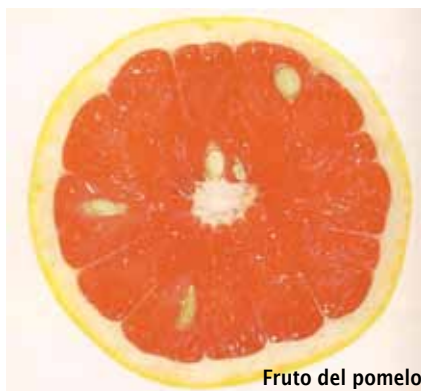
Fruto del pomelo

Su colega el Dr. Allan Sachs de Nueva York, desarrolló en el año 1990 un estudio clínico a fin de demostrar la eficacia del extracto de pomelo como alternativa natural y compararlo con