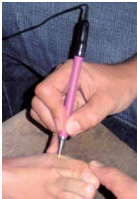
Punto de Nucleasas en el Páncreas

del sistema hormonal. Además, en los puntos denominados Puntos de Control, pueden identificarse tanto una infección como una intoxicación o una inflamación nerviosa. No obstante, un estudio energético no debe