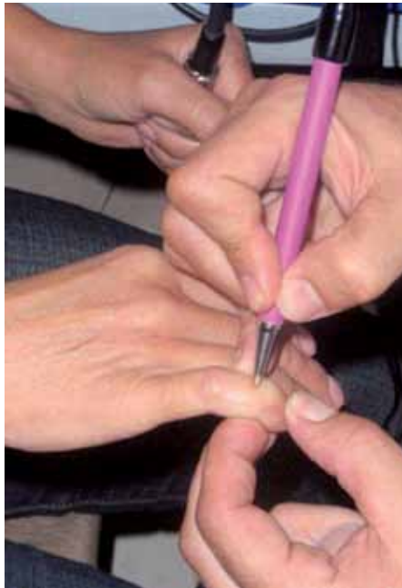
Punto de sistema nervioso de corazón

precedidas de alteraciones en el cuerpo etéreo). Además, esta técnica nos revelará enfermedades del cuerpo físico