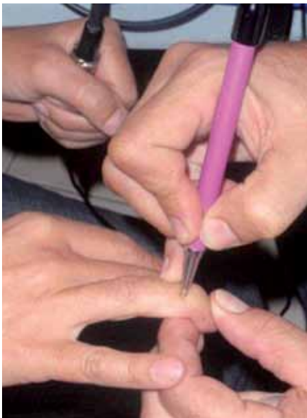
Punto de cadena simpática (sistema nervioso del sistema hormonal)

De esta manera, la electropuntura bioenergética nos permite medir efectivamente los desequilibrios de la energía sutil, precursores de la enfermedad (siempre y cuando las enfermedades o disfunciones físicas vayan